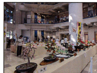
工芸菓子展示(イメージ)