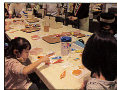
オーナメント作製体験(イメージ)