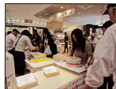
重さ当てクイズ(イメージ)