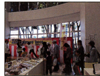
じゃんけん大会(イメージ)